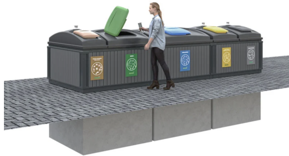
Esquema de contenedor semisoterrado

Aunque puedan parecer sistemas de almacenaje similares, los semisoterrados son soluciones muy distintas a los contenedores totalmente soterrados. A continuación, se enumeran algunas de las diferencias más notables.